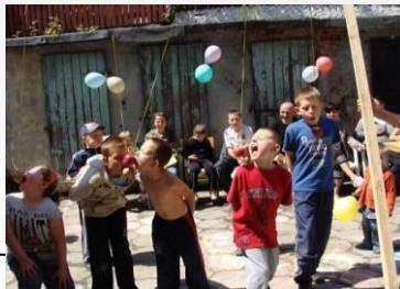
Działania integrujące, aktywizujące sąsiadów 2012