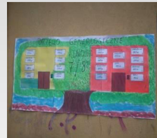
Historia miejsca, tożsamość lokalna 2014