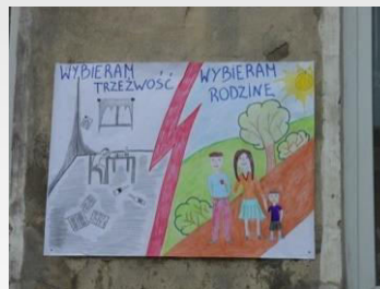
Działania profilaktyczne 2013