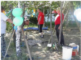
Wizualna zmiana podwórka 2011