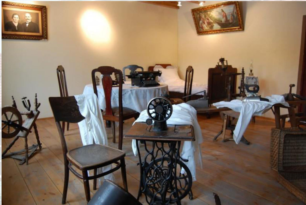
Rys. 6. Muzeum Miejsca Parku Kulturowego Miasto Tkaczy.