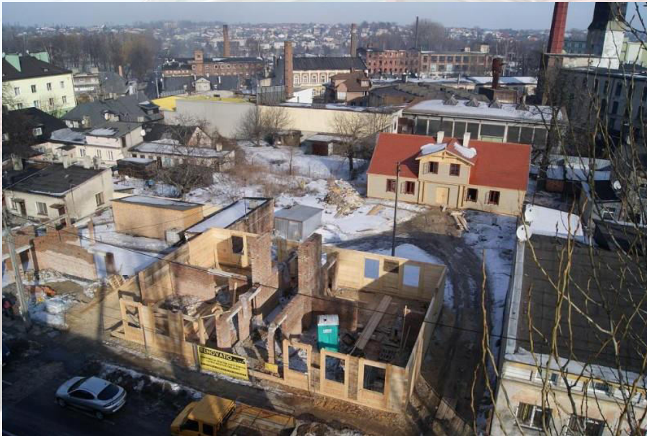
Rys. 4. Prace remontowe przy ul. Ks. Sz. Rembowskiego 6.