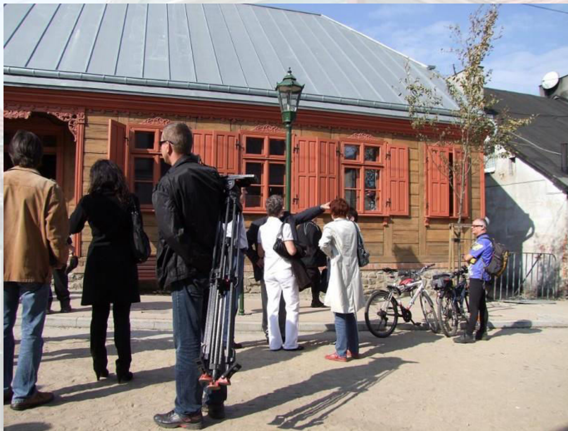
Rys. 5. Centrum Konserwacji Drewna.