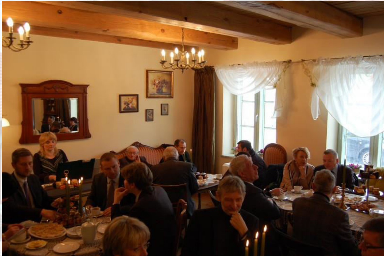
Rys. 7. Restauracja Biedermeier Bistro.