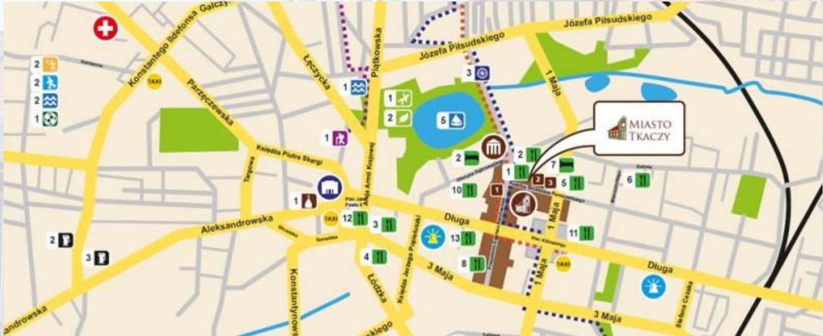
Rys. 1. Położenie Parku Kulturowego Miasto Tkaczy w Zgierzu.